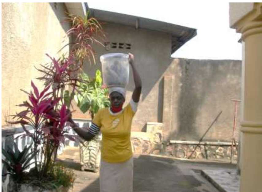
文中の魚売りの女性

この日購入した魚（淡水魚約 21 cm）は、約 1 キロ、約 400 円。時々、リリマの湖でとれた魚（同種類）もあります。調理法は味がたんぱくなので丸ごと揚げてそのまま食べるか揚げたてのものを野菜と一緒に煮込む、塩焼きなどです。