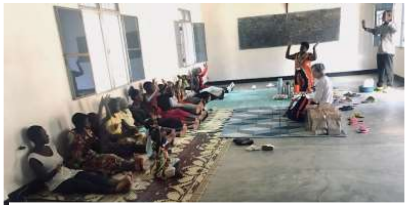
子供たちが一堂に会した様子。三密です・・・

集まった子供たちの中には、私に甘えようとぴったり身体をくっつけてくる女兒がいました。私が誰かと話していると来るのを控え、独りになると直ちにやって来てスキンシップを求める彼女は、甘えたくても甘えられない境遇にあります。またトラウマの症状が明らかに見られる思春期の女性も、気になります。